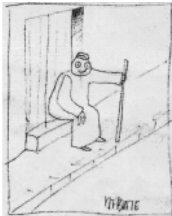
Ilustración de Antonio Berjillos

El diccionario DEA Espasa Calpé, dice en una de sus acepciones: "(de albañilería). Sardinell, escalón.