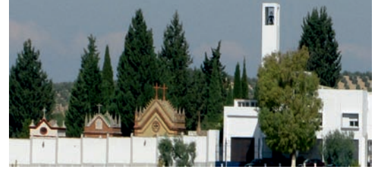
CEMENTERIO DE PUENTE GENIL

festividad de TODOS LOS SANTOS Y FIELES DIFUNTOS NOVIEMBRE 2012